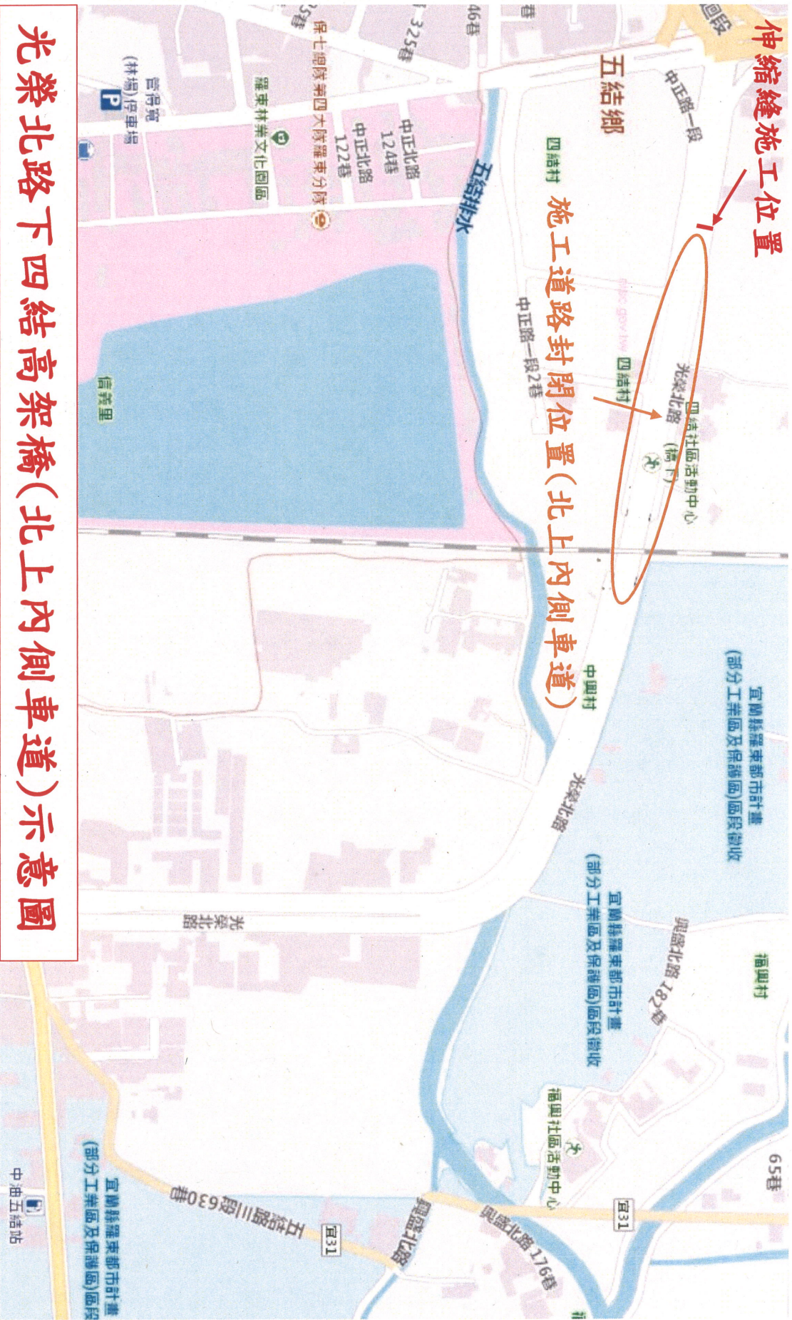
光榮北路下四結高架橋(北上內側車道)示意圖